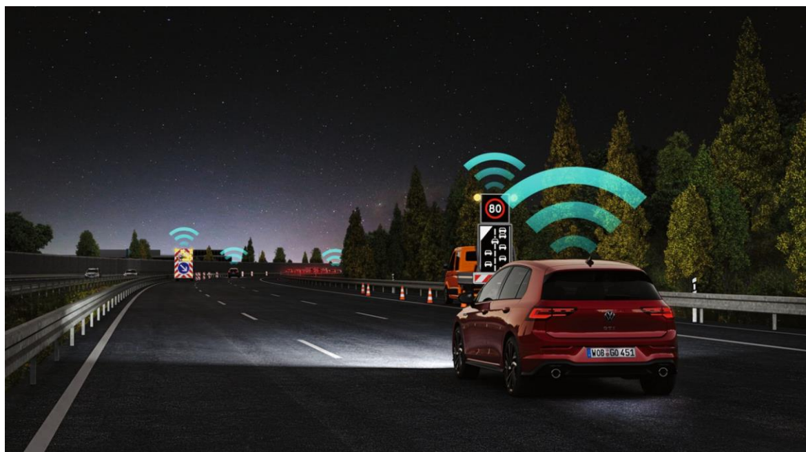
Obrázek 2: Varování před nebezpečím na trase.

Řešení: město vytvoří standardizované hlášení a systém je distribuuje do vozidel v okolí a do informačních kanálů města. Klíčové je mít proces: kdo hlášení zakládá, kdo potvrzuje a kdy se ruší.