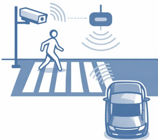
Obrázek 3: Chodec na přechodu – detekce a varování (převzato ze zdrojového manuálu).

Řešení: detekce chodce + včasné varování řidiči. Součástí služby musí být i data pro vyhodnocení a pro cílené úpravy.